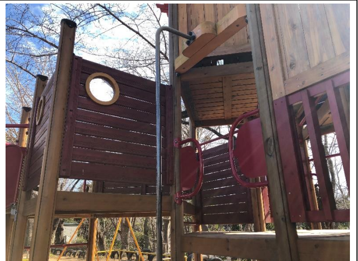
[ゆうぐうじょう]棒