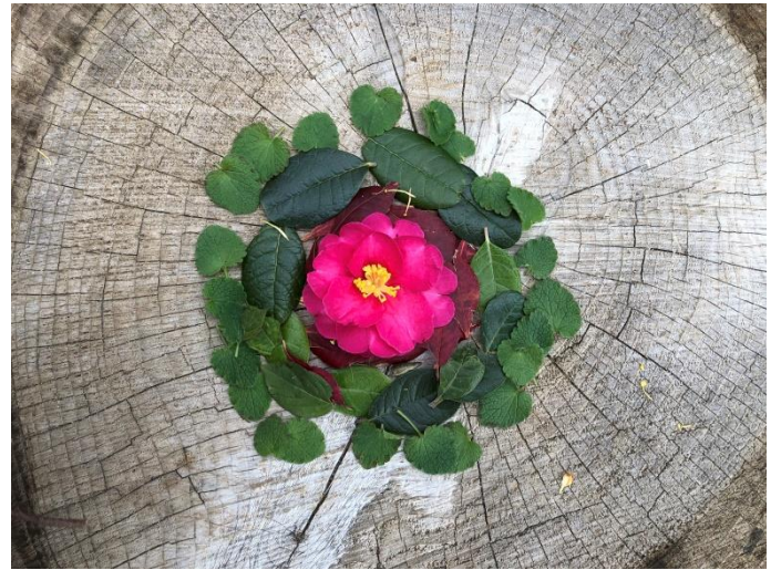
葉っぱ、花びら集め