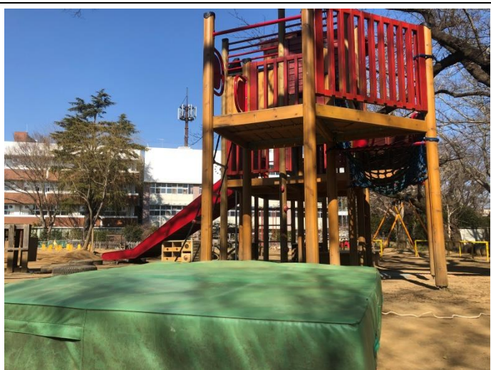
[ゆうぐうじょう]ジャンプ台