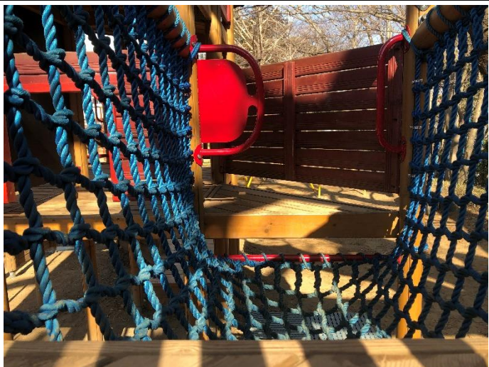
[ゆうぐうじょう]橋わたり