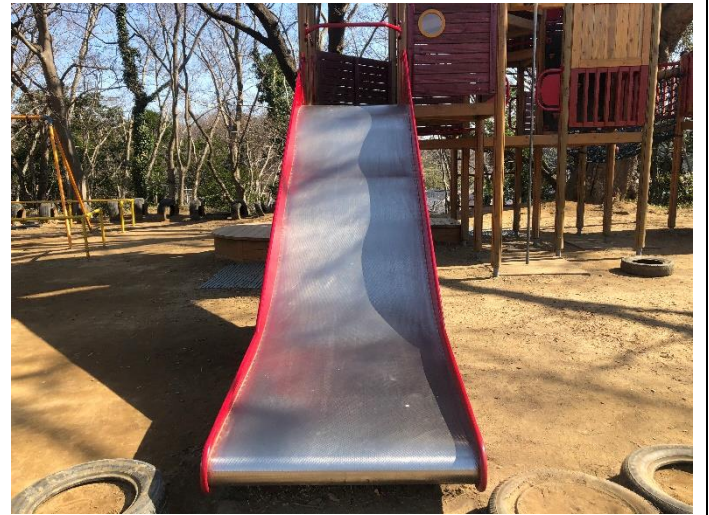
[ゆうぐうじょう]滑り台