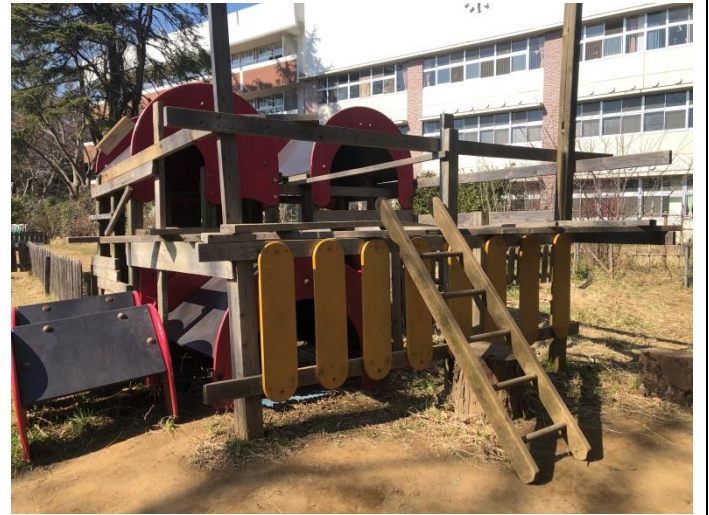
とりで (旧総合遊具)