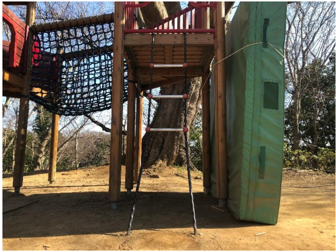
[ゆうぐうじょう]ハシゴのぼり