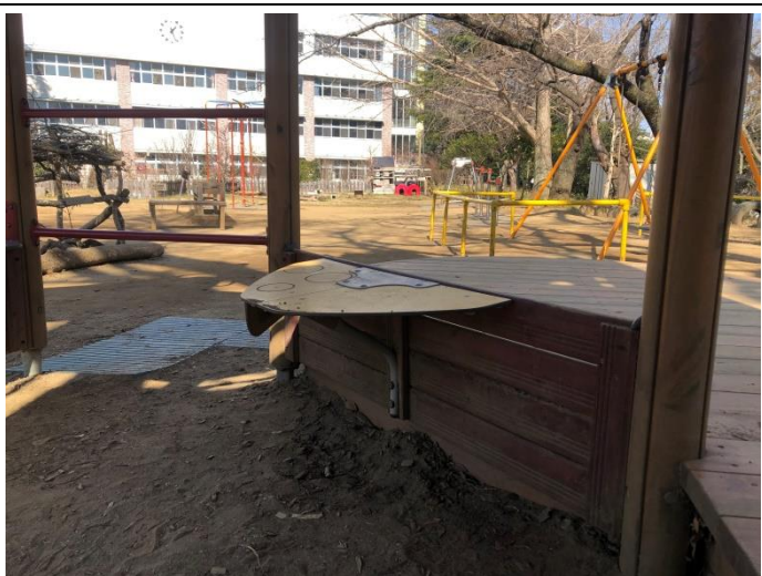
[ゆうぐうじょう]料理ごっこ